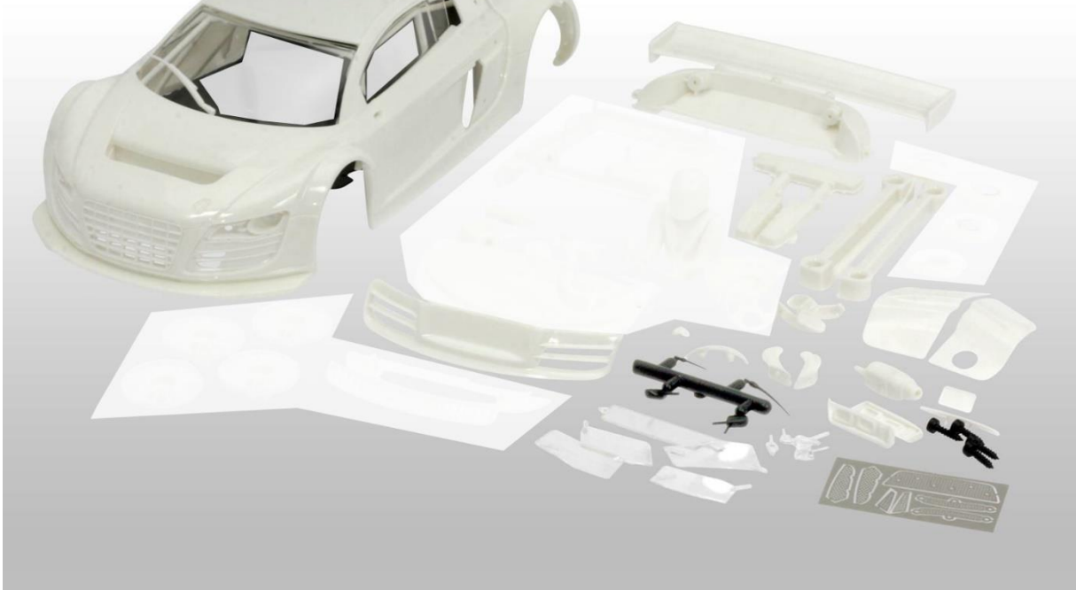
4.6 BMW Z4 GT3