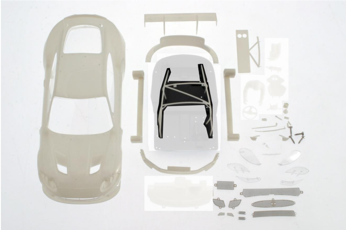
4.4 Mercedes SLS AMG GT3